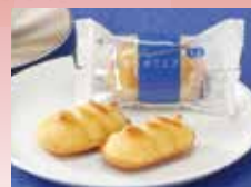
新東京ぼてとプレミアムミニ

5種類のさつまいもをブレンドした 「新東京ぼてとプレミアムミニ」と 徳島県産鳴門金時を100%使用した 「新東京ぼてと」の詰め合わせ。