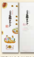
※写真は1本入(11切れ)です

5個入 スリープ箱 918円(税込) 8個入 1,473円(税込) 10個入 1,815円(税込) 1本入 (11切れ) 994円(税込) 2本入 1,987円(税込)