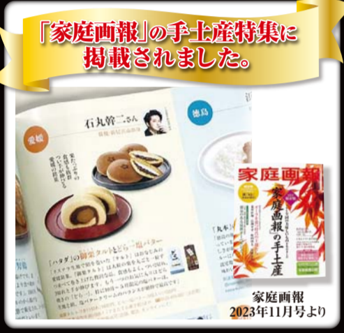
「家庭画報」の「手土産特集」に掲載されました。

20個入 3,100円(税込) 送料別 16個入 2,500円(税込) 10個入 1,600円(税込) 8個入 1,300円(税込) 5個入スリーブ箱 780円(税込)