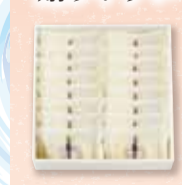
ハタダ栗タルト 16個入 2,500円(税込)