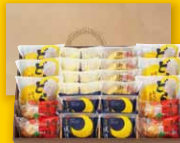
厳選ギフトB お菓子 22個入 3,921円(税込)