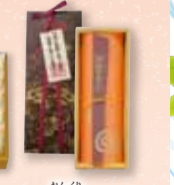
ハタダ栗タルト 10個入 2,150円(税込)