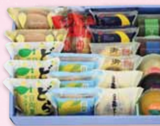
お菓子 26個入 4,990円(税込)