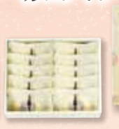
ハタダ栗タルト 10個入 1,600円(税込)