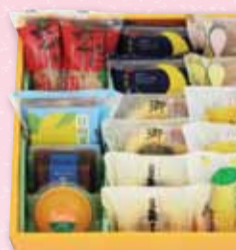
お菓子 16個入 2,961円(税込) ※岡山地区 3,013円