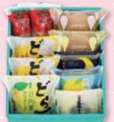
お菓子 10個入 1,659円(税込) ※岡山地区 1,713円

人気のどら いち おもいでカスタードや季節限定のゼリー、水ようかん、そして新発売のどら いち 日向夏カスタード、媛の月日向夏など、ハタダの自慢の銘菓を詰め合わせました。バラエティに富んだおいしさをお楽しみいただけます。