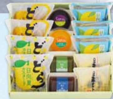
お菓子 13個入 2,723円(税込)