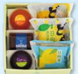
お菓子 6個入 1,455円(税込)