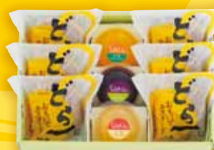
お菓子 9個入 2,094円(税込)