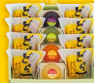
お菓子 12個入 2,742円(税込)