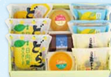
お菓子 10個入 2,114円(税込)