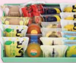
お菓子 20個入 3,806円(税込)