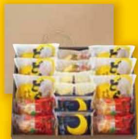
厳選ギフトA お菓子 16個入 2,911円(税込)